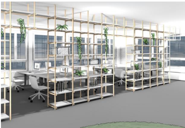
Perspektiven von Bogen Design