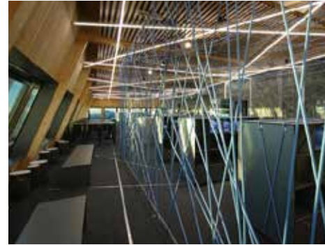
Bemerkenswerte Projekte aus dem Detailhandel werden künftig im Mittelpunkt der «shopARENA» von BINDER INTERIOR stehen.